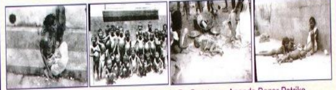
Bengal Famine, 1943 - Calcutta Scene.